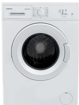
la machine à laver la machine à laver