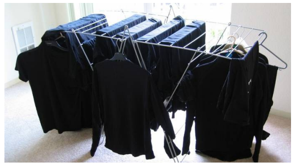
le linge noir le linge noir