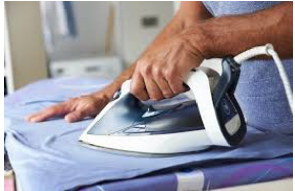
le fer à repasser le fer à repasser