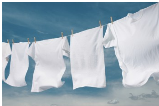
le linge blanc le linge blanc