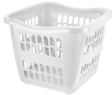
le panier à linge le panier à linge