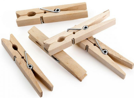
les épingles à linge les épingles à linge