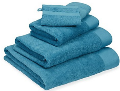
le linge plié le linge plié