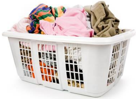
le linge sale le linge sale