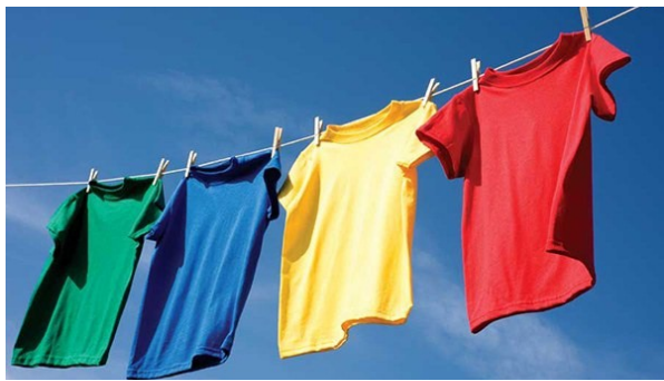
le linge de couleurs le linge de couleurs