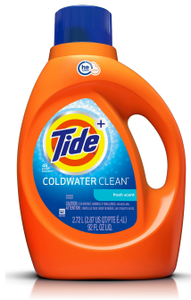
la lessive liquide la lessive liquide