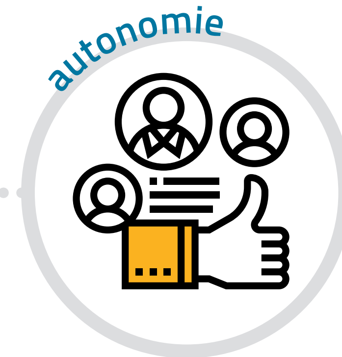
Rétroaction, feedback du groupe et de l'enseignant