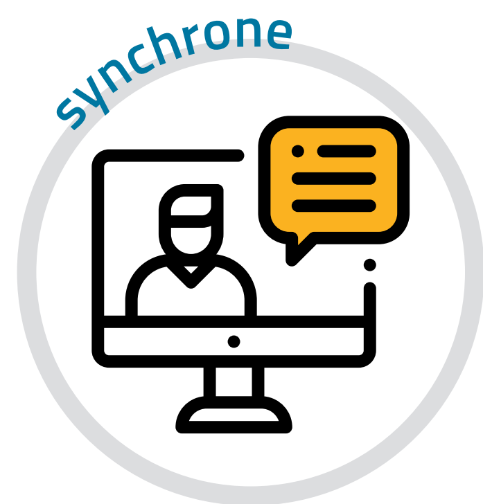
Classe virtuelle de lancement